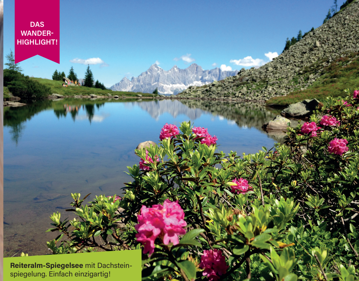
Reiteralm-Spiegelsee mit Dachstein-spiegelung. Einfach einzigartig!