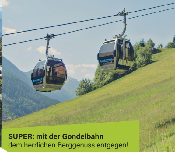
SUPER: mit der Gondelbahn dem herrlichen Berggenuss entgegen!

TIPP: Seilbahn Preunegg Jet barrierefrei benutzbar!